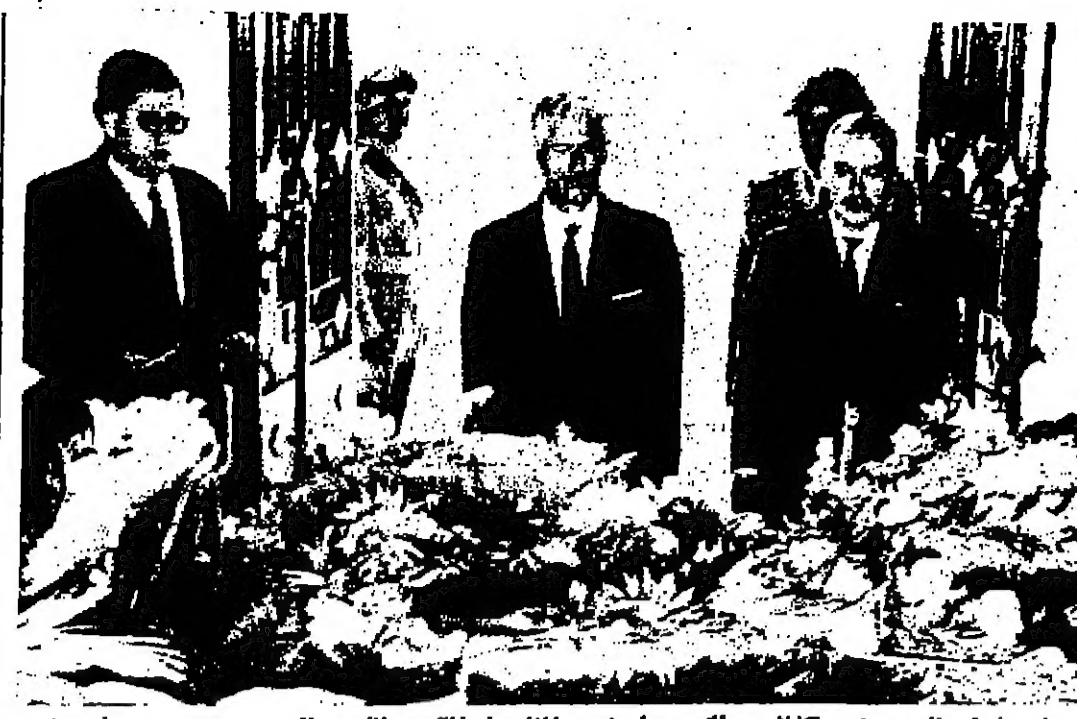
مدير تشييد الجديد يضع اكليلا من الزهور على شريح المنفور له الملك عبدالله بن الحسين

١ - اويل ريكورد موديل ١٩٦٥ . ٢ - كبر فان موديل ١٩٦٦ . ٣ - دودج سالون موديل ١٩٥٩ . المراجعة مع هاتف ٢٤٦٢٧ - عمان